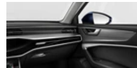
Tableau de bord et revêtement de porte en deux pièces et une/plusieurs couleurs

Inserts décoratifs en aluminium Mat Brossé Foncé