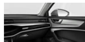
Tableau de bord et revêtement de porte en deux pièces et une/plusieurs couleurs

Inserts décoratifs en aluminium Dyade Argent Jangal