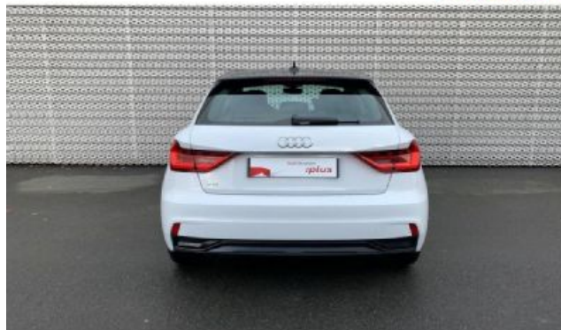
Audi Occasion plus