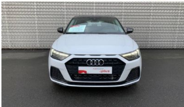
Audi Occasion plus