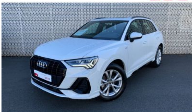
Audi Occasion plus