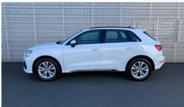
Audi Occasion plus