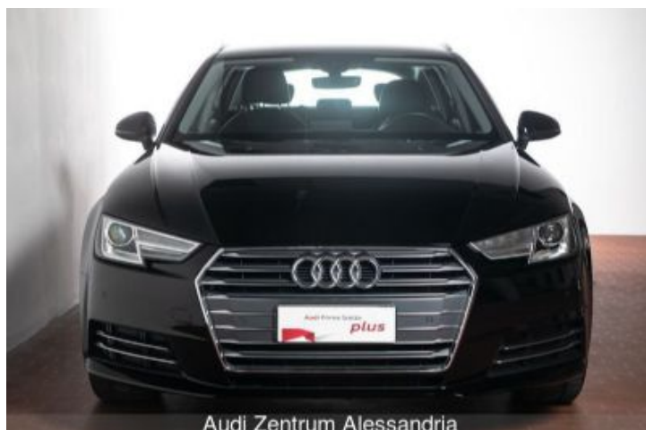
Audi Zentrum Alessandria