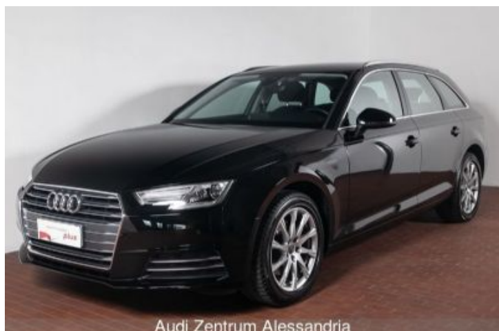
Audi Zentrum Alessandria