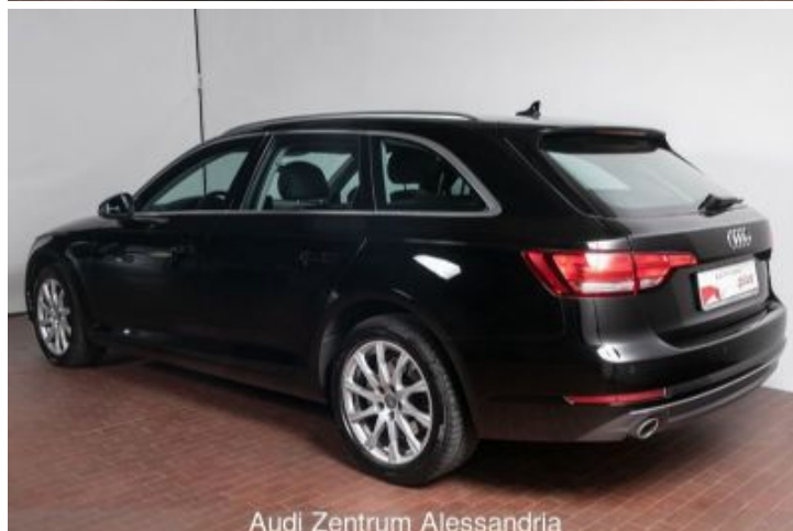
Audi Zentrum Alessandria