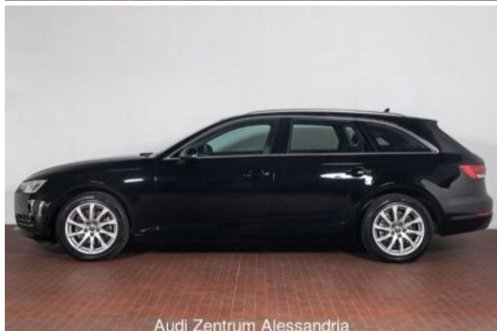
Audi Zentrum Alessandria