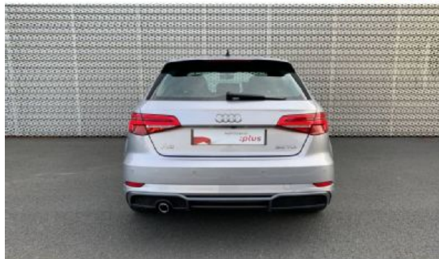
Audi Occasion plus