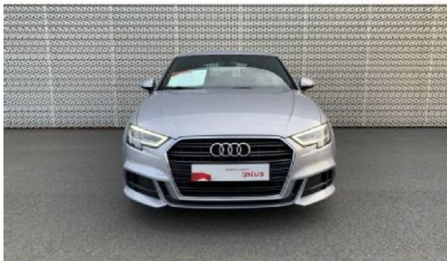
Audi Occasion plus